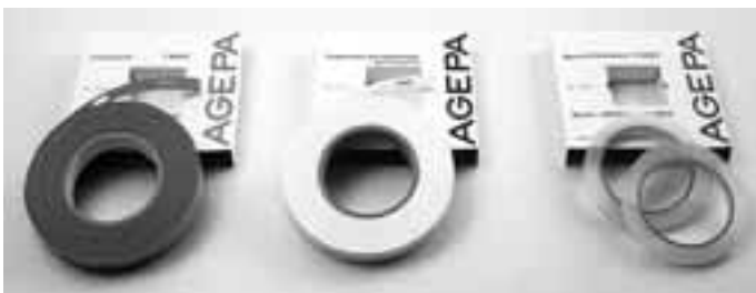
Trägerband T 6622

Zum Schutz gegen Beschädigung und Verschmutzung von Plänen, aus glasklar PVC mit AGEPA-Lochung. Formate: DIN A4 – A0 sowie Grundbuchpläne.