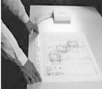
Trägersteifen 33/12 und 33/25

Rollen à 33 m, auf einfachste Weise von Hand zu befestigen, selbstklebend, gelocht, hitzebeständig, alterungsbeständig, beschriftbar.